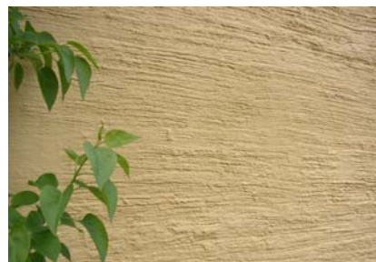
Rekommenderad ytstruktur mot Kedjehusvägen

Fasader och murar: Båda gavlarna och muren på den sida som vetter mot Kedjehusvägen bör behålla sin kvastade yta, eller ges en ytstruktur som ansluter så nära som möjligt. Däremot har långsidorna mot trädgårdarna varit slätputsade och kan med fördel fortsätta vara det.