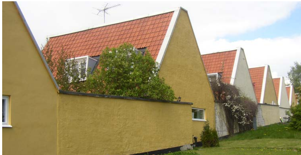
Fasader och murar mot Kedjehusvägen

Murarna mot Village Green målas i samma kulör som det hus de sitter ihop med och som ligger närmast söderut, dvs. grannens hus. Detta för att kulören ska bli densamma över hela den sammanhängande murytan. Gå gärna ihop med grannen och köp färg!