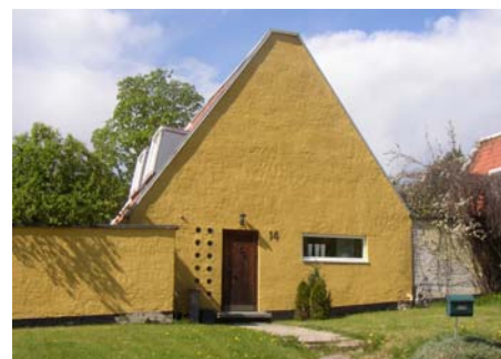
Fasader och murar mot Kedjehusvägen

Takkupor och plåtdetaljer på tak (vindskivor, vatt- ochnockplåtar): förzinkat grå.