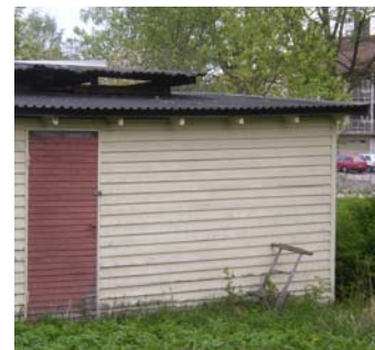
Goda förebilder finns i området