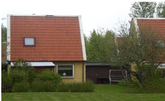
Fasad mot trädgårdssida

Tilläggsisolering av vindsbjälklag går bra, däremot fungerar inte tilläggsisolering av fasad p.g.a. takets utformning.