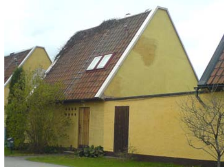
Fasad mot entrésida