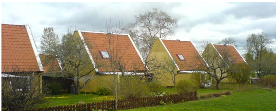
Fasader mot trädgårdssida