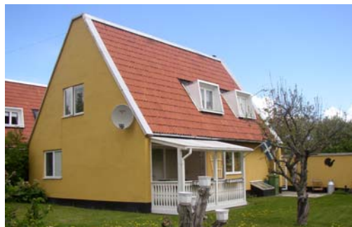
Fasader och murar mot trädgårdssidan

Murarna mot Village Green målas i samma kulör som det hus de sitter ihop med och som ligger närmast söderut, dvs. grannens hus. Detta för att kulören ska bli densamma över hela den sammanhängande murytan. Gå gärna ihop med grannen och köp färg!