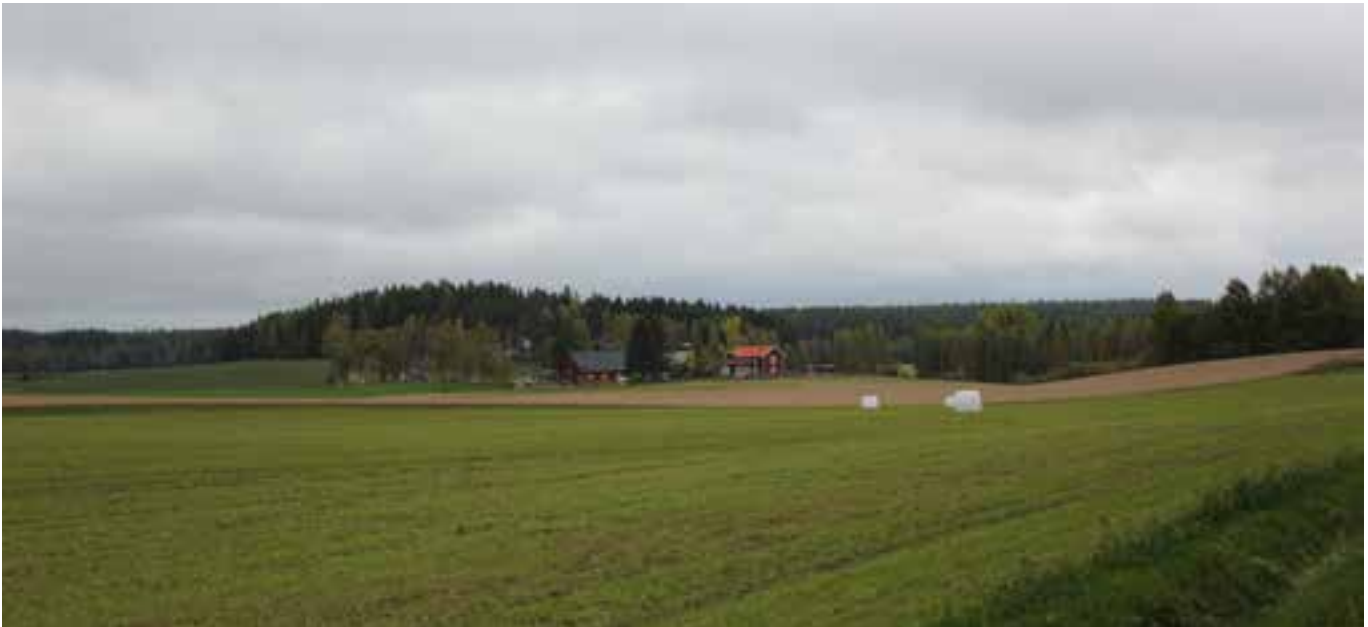
Jordbruksmarken står för flera ekosystemtjänster.