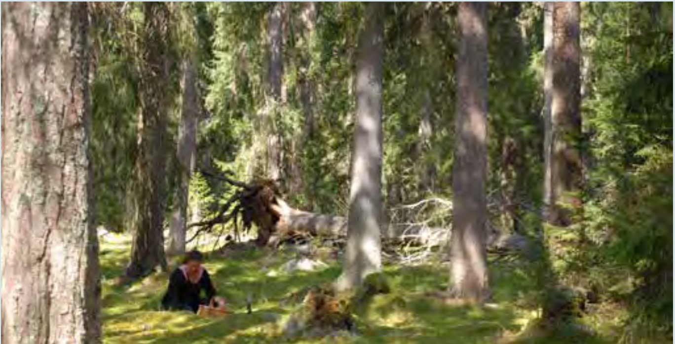
I kommunen finns stora möjligheter till att vistas i skog och mark.