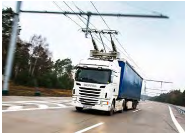
Projektet Elväg E16 bidrar till utvecklingen av hållbara transporter.

Transporter och IT-infrastruktur är två vägar för att nå målområdet ”Tillgängliga miljöer” som identifierats i Region Gävleborgs regionala utvecklingsstrategi ”Nya möjligheter”.