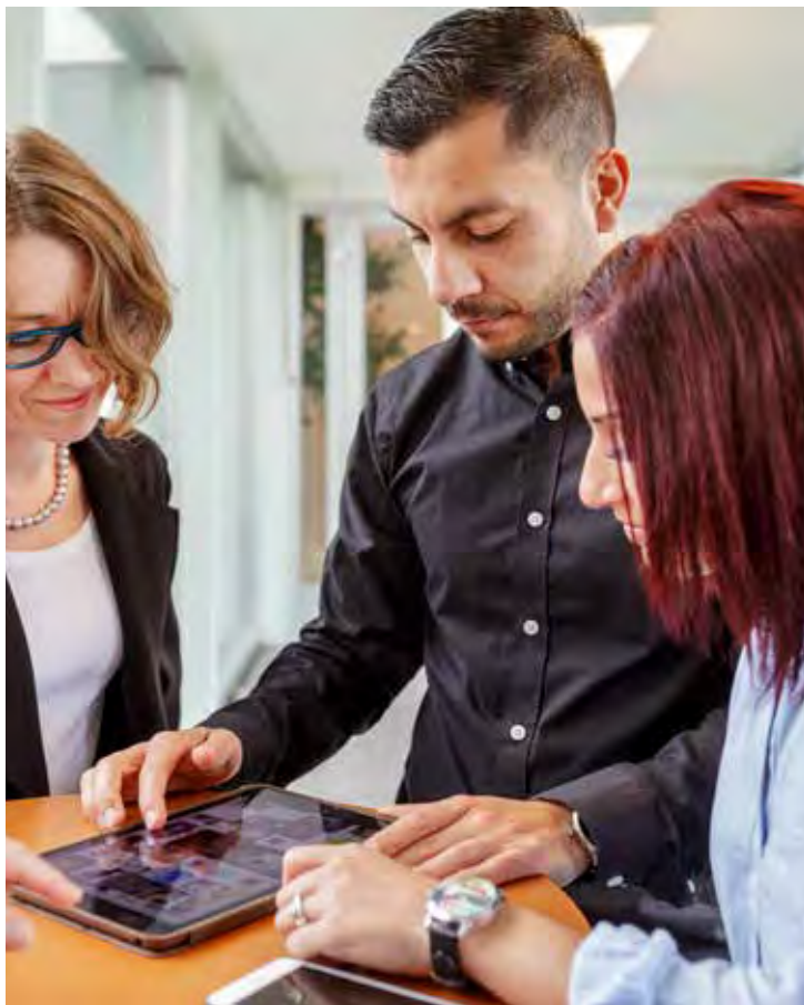
Ny teknik skapar nya behov och krav från både medborgare och medarbetare.