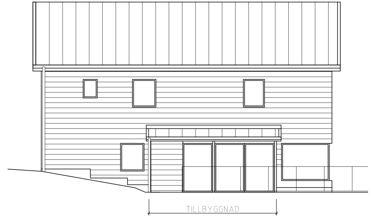
Fasad mot väster, inglasat uterum