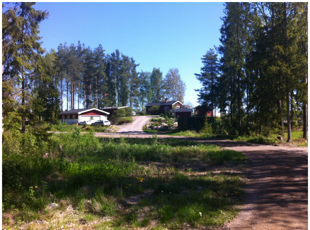
Hus på Åbyggenäs

Detaljplan för del av fastigheten Ulriksdal 3:1 m.fl. i Sandviken, Sandvikens kommun, Gävleborgs län