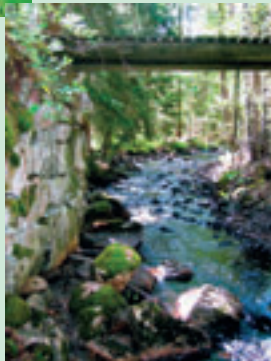
Där hammaren i Oppsjö en gång fanns.

6. Gjusberget ger dig en fin utsikt. Alldeles intill ligger naturreservatet Köpmanmossen .