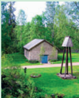
Kapellet vid Kratte Masugn.

Vid Kratte Masugn finns iordningställda naturstigar och mindre skogsvägar som ger dig möjligheter att göra dina egna vandrings-slingor i en gammal och intressant järnbruksamjö med många spår från den aktiva epoken.