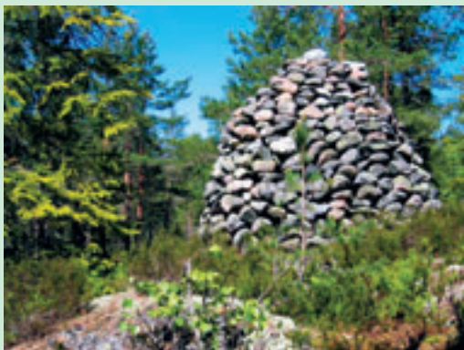
Stensulptur vid Bårhällarna.

Förslag på start och slutpunkt är Ulvkisbosjön.