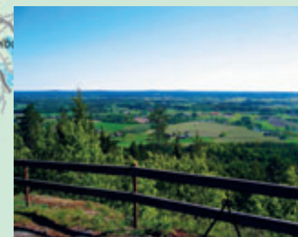
Utsikten från Rönnåsstugan..

16. Kolarkojor var förr vanliga i skogen. I Kerstis koja på Rönnåsens nordsluttning kan du göra dina egna kolbullar.