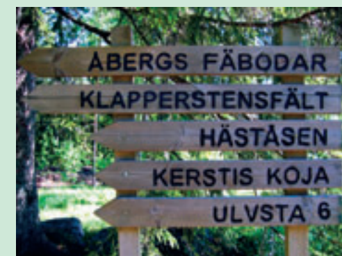
Utflyktstips på Rönnåsen.

17. Rönnåsen , med bland annat klapperstensfält och en fantastisk utblick över Testeboåns dalgång, Bysjön med flera sjöar och Ockelbo samhälle, är ett av Gästrikledens populäraste utflyktsmål. Friluftsförbundet har sommarcafé i toppstugan.