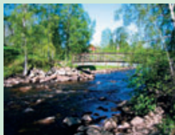
Leden går över Bresiljeån i Åmot.

10. Sjukällan är en naturlig källa som springer fram ur Åsens sydsluttning.