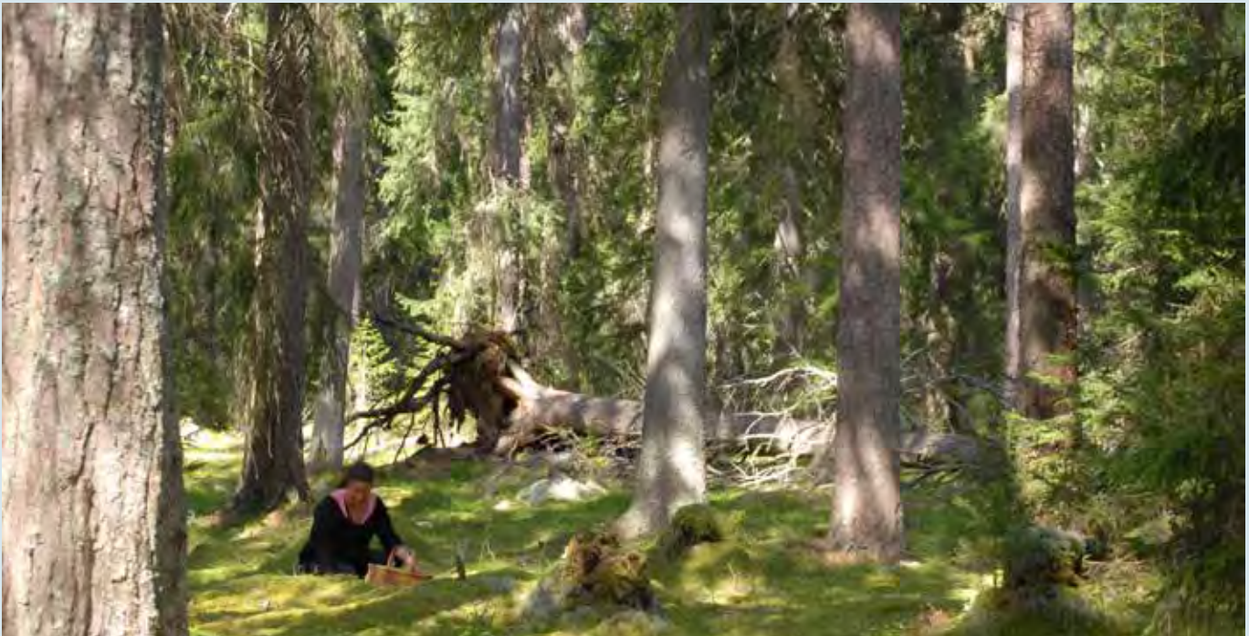
I kommunen finns stora möjligheter till att vistas i skog och mark.