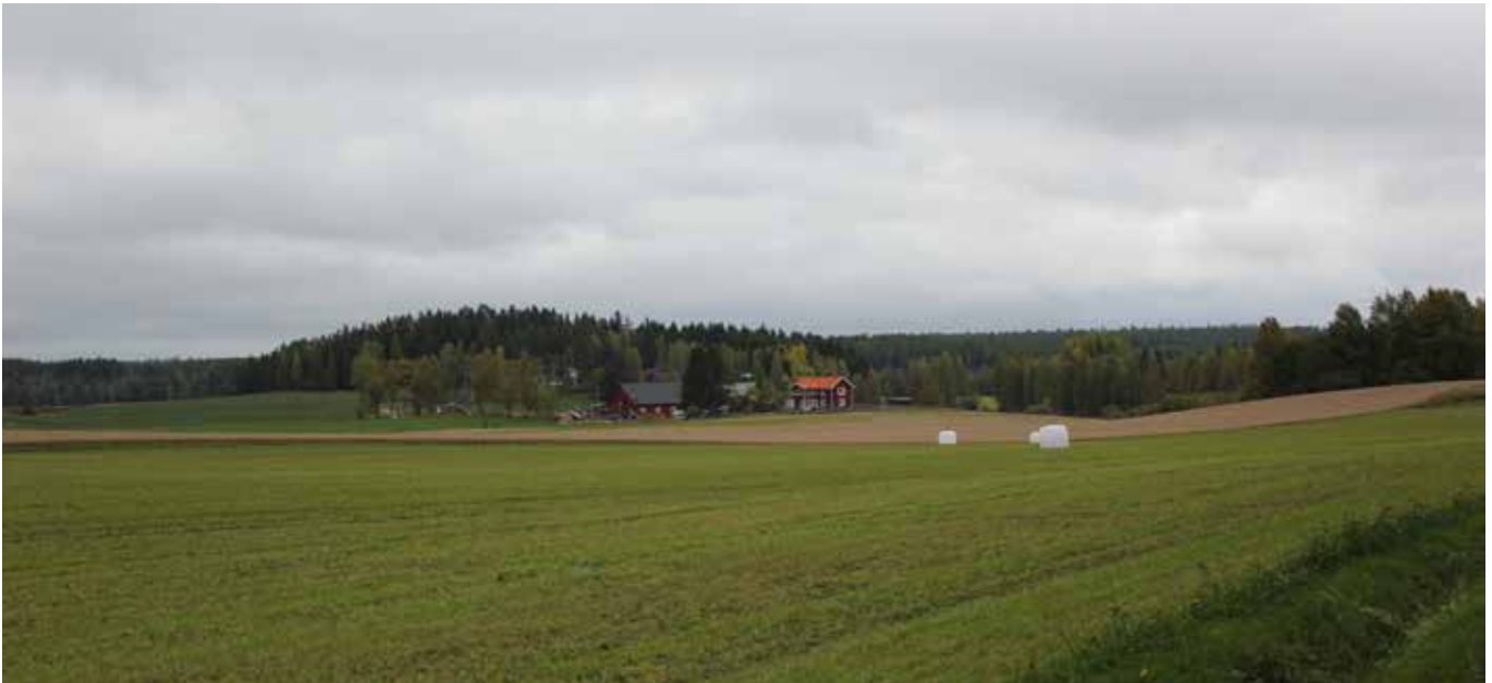
Jordbruksmarken står för flera ekosystemtjänster.