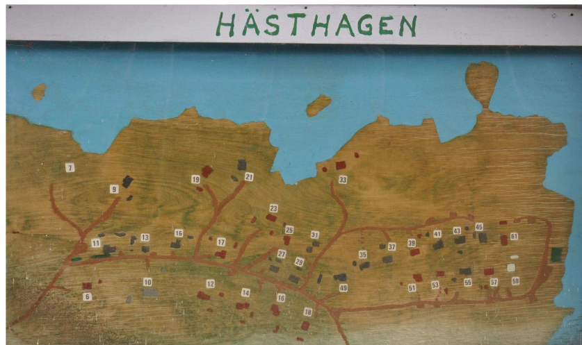
Orienteringstavla över Hästhagen

Detaljplan för del av fastigheten Överbyn 7:1, 7:39, 7:44 m.fl. i Högbo, Sandviken, Sandvikens kommun, Gävleborgs län