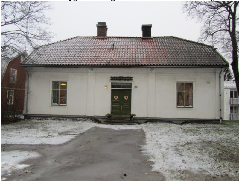
Sockenstugans södra fasad.

I Sockenstugans yttertrappa finns årtalet 1724 inhugget. Detta är dock osäkert om det är det gällande året för uppförandet av Sockenstugan. Troligen har byggnaden uppförts någon gång under 1700-talet. Verksamheter som har bedrivits i Sockenstugan är t.ex. skola, läkarmottagning, sammanträdeslokal, m.m. Idag används Sockenstugan som vävstuga och i källaren finns hembygdsföreningens arbetslokal samt Ovensjö hembygdsföreningsarkiv.