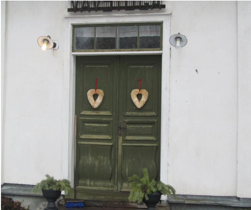
Ytterdörr med rokokoformer.