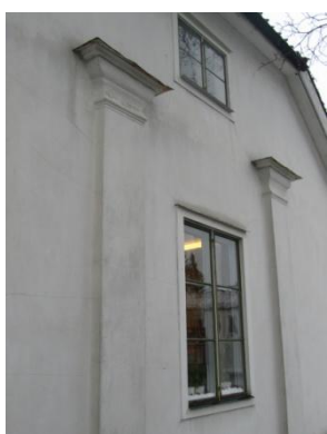
Doriska pilastrar.

Alla fasader, förutom den norra, består av reveterat liggande timmer. Den norra fasaden är panelklädd med locklistpanel. Vägghöjden är vit. Fasaden är putsad med KC-bruk och avfärgad med en vit silikatfärg. Den norra fasaden är målad med en modern oljefärg. Som dekoration finns doriska pilastrar och dragen taklist av KC-bruk. På den norra fasaden motsvaras det av klassicistiskt utformad panel.