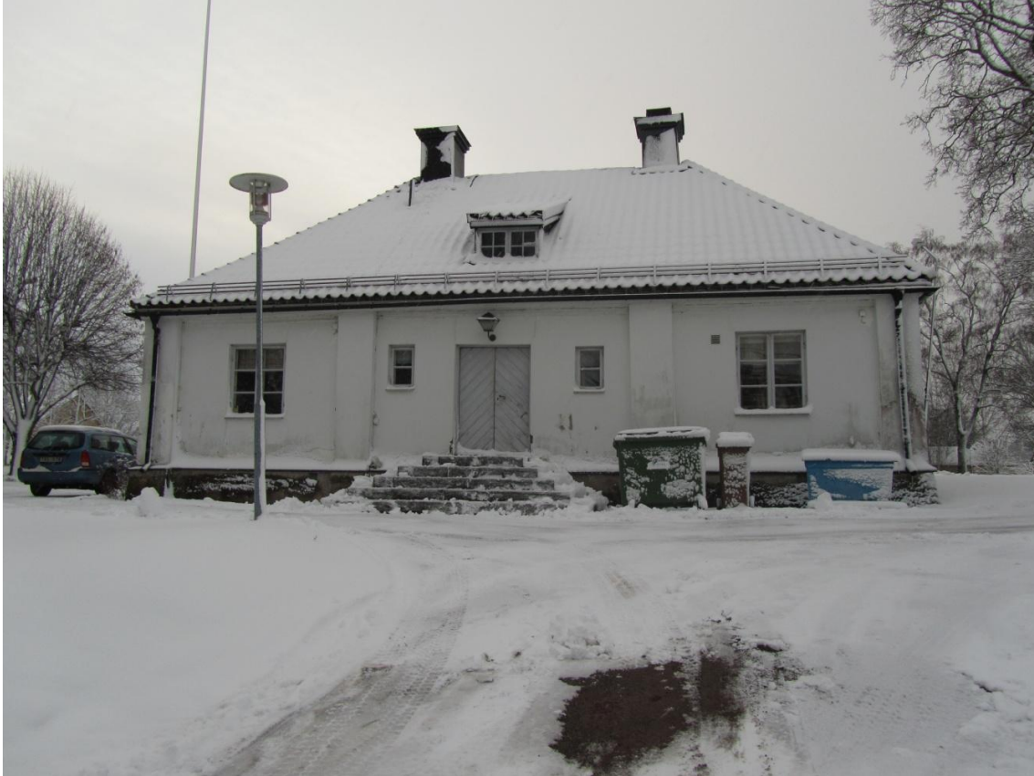
Lagmansgårdens norra fasad.