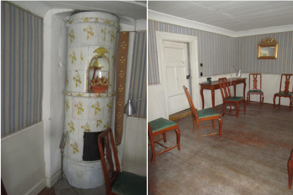
T.v. Kakelugn från slutet av 1700-talet som står i salen. T.h. Salen med brüdgolv, bröstpanel, spegeldörr, sockel, taklist och brädtak med handsmidda spikar. Alla dessa detaljer gör en kulturhistorisk helhet.