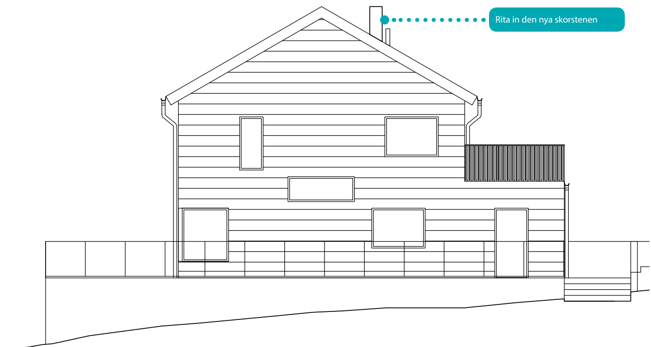
Fasad mot väster eldstad