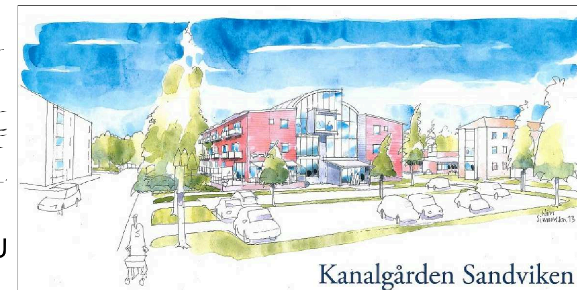
Perspektiv från Torggatan på det föreslagna trygghetsboendet. Perspektivet är framtaget av Arkitektgruppen.