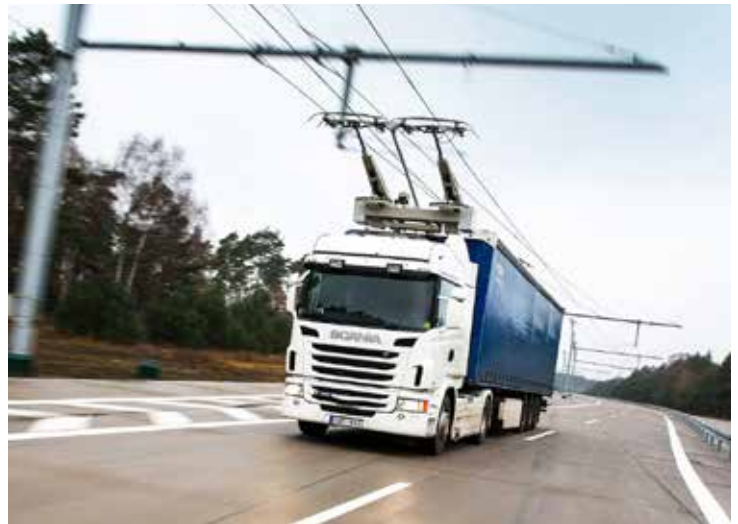
Projektet Elväg E16 bidrar till utvecklingen av hållbara transporter.

Transporter och IT-infrastruktur är två vägar för att nå målområdet ”Tillgängliga miljöer” som identifierats i Region Gävleborgs regionala utvecklingsstrategi ”Nya möjligheter”.