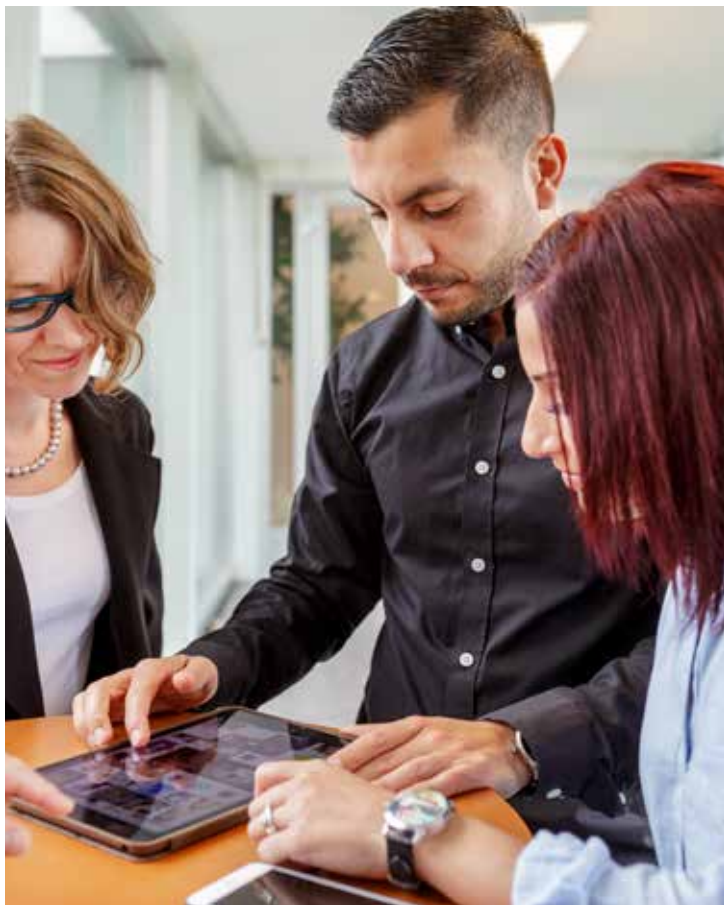
Ny teknik skapar nya behov och krav från både medborgare och medarbetare.