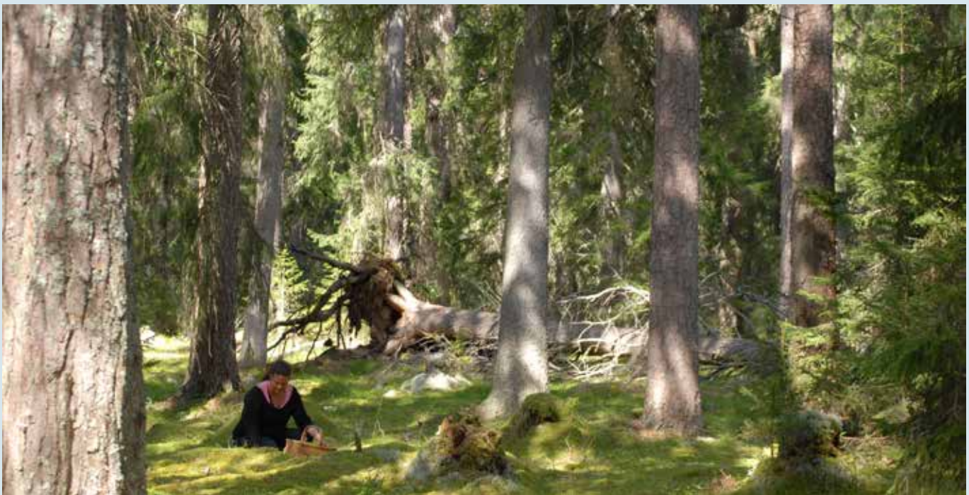
I kommunen finns stora möjligheter till att vistas i skog och mark.