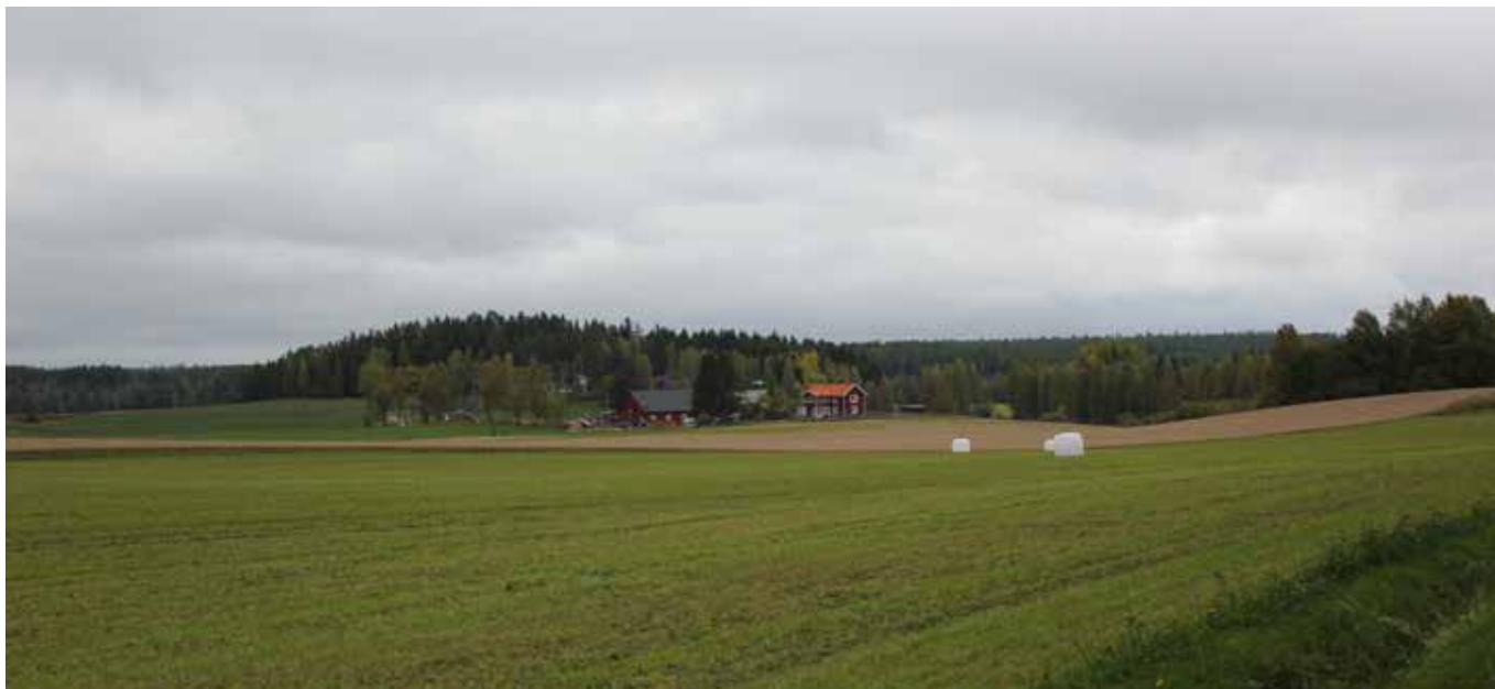
Jordbruksmarken står för flera ekosystemtjänster.